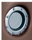
portina di ispezione